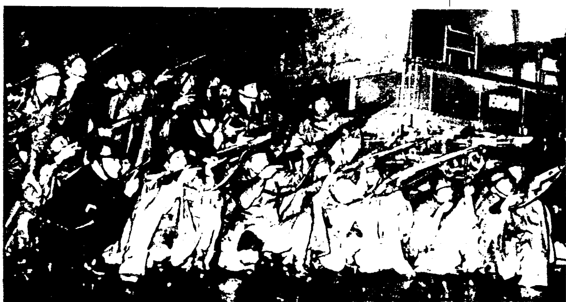
Los nietos de Zapata —con uniforme o sin él— se han exaltado.

Y, sin embargo, Haya de la Torre ya no es el ardiente y romántico jefe revolucionario de los años veinte —la Alianza Popular Revolucionaria Americana fue fundada en Méjico, en 1942, durante uno de los exilios de Haya de la Torre— ni el peligroso doctrinario marxista que pretendían sus enemigos. El APRA fue en un principio un movimiento revolucionario, indigenista y continental. Su fundador y sus colaboradores coquetearon con el marxismo, como muchos de los revolucionarios de aquellos años. Y, con ellos —el venezolano Rómulo Betancourt nos presenta otro ejemplo característico—, la edad y la cercanía del poder han ido mitigando sus primitivos ardores. Hoy el APRA, especialmente después de su colaboración parlamentaria en los cinco