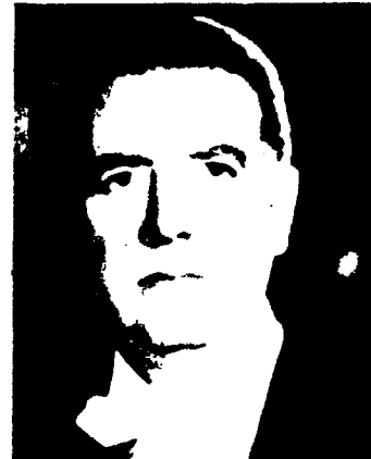
Belaunde cumplió sus promesas.

Zapata o de Venustiano Carranza? ¿Quién no conoce la «Adelita» o la «Cucaracha»? Como no podía menos que suceder, este mito revolucionario ha influido poderosamente en la mentalidad colectiva de los mejicanos actuales. Es característico que el partido gubernamental se llame «revolucionario institucional». Sin embargo, la realidad social dista mucho de ajustarse a la mitología oficial.