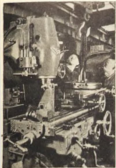
La industria moderna, que cada día realiza nuevas conquistas a la ciencia ha conseguido perfeccionarse de una manera asombrosa. He aquí a unos mecánicos alemanes montando un nuevo modelo de fresadora, para la fabricación de automóviles.