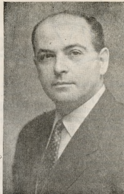
El Delegado Nacional de Sindicatos, camarada José Solís Ruiz.

Al dar cuenta de tan laudatoria comunicación, lo hacemos, para que quede constancia pública de este reconocimiento, que, sabemos, encuentra en el profesorado del Centro la íntima satisfacción del cumplimiento, sin regateos, del deber docente.