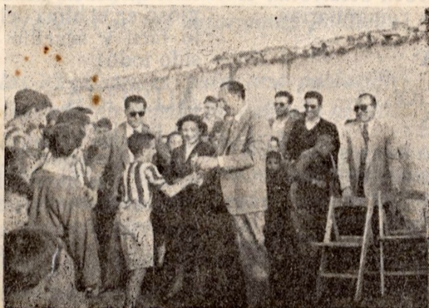
Entrega de la copa al equipo vencedor.

Durante este último trimestre del curso escolar se han efectuado marchas radiales a «El Pico», «Zuacorta», «Navaseca» y «Siles».