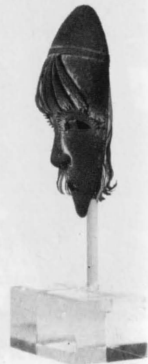
PABLO GARGALLO. Jeune fille à la frange.