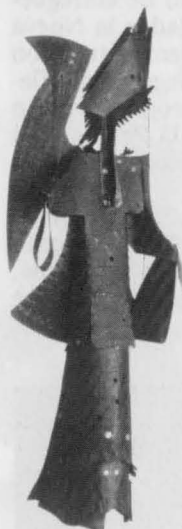
ALBERTO SÁNCHEZ. Homenaje a las mujeres.

«Una Colección de Escultura Moderna Española con Dibujo» fue el título de la exposición que se expuso en el Museo de Albacete del 25 de noviembre al 26 de diciembre. Esta colectiva fue organizada por Cultural Albacete con la colaboración del Instituto de Crédito Oficial, ya que la misma es una producción de la citada institución.