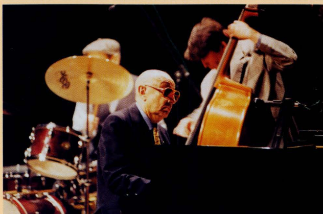
Tete Montoliu en su actuación dentro del ciclo dedicado al jazz que organizó Cultural Albacete