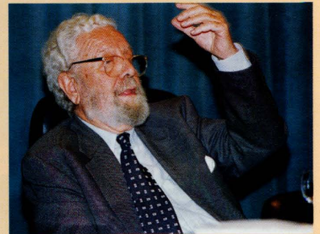
El director cinematográfico Luis García Berlanga abrió el ciclo "100 años de cine en Albacete". "El cine, mi pasión a extinguir", fue el título de su conferencia

Conferencia. 100 años de cine en Albacete. Invitado: Luis García Berlanga . Salón de Actos de la Excma. Diputación de Albacete.