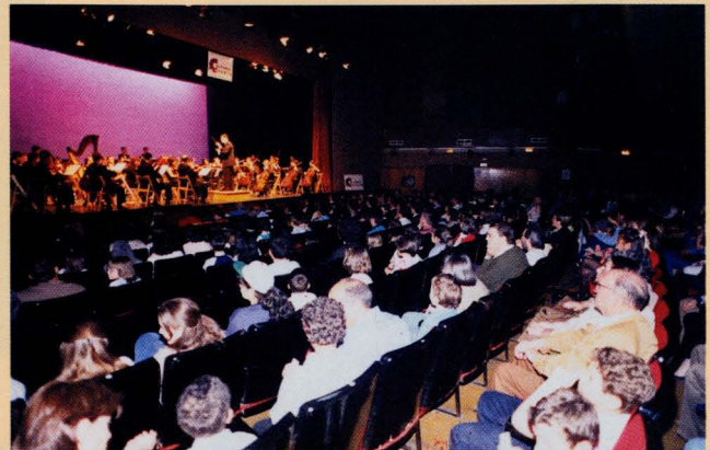
La Orquesta Sinfónica de Albacete ofreció un concierto extraordinario dedicado a niños, en la Sala San Pol de Madrid