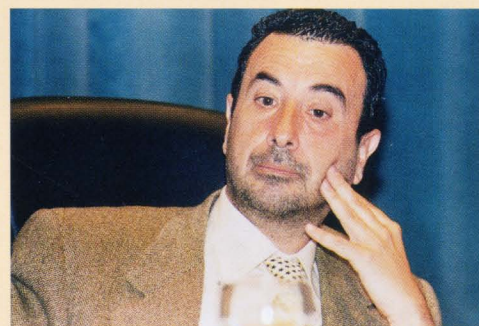
José Luis Garcí tituló su charla "Cine y literatura"

Música. XV Ciclo de Conciertos en el Órgano Histórico de Liétor. Intérprete: Dúo Lurka . Iglesia Parroquial Santiago Apóstol.