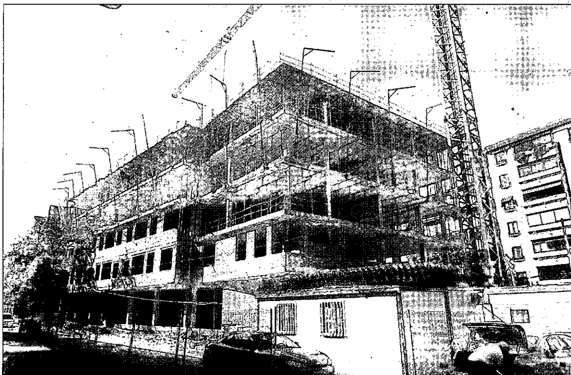
Una promoción de viviendas que está en construcción en la capital.

Otra reforma que afectará a la compra, según el responsable de la APEC, será la eliminación de las deducciones por la compra de un piso, lo que, en principio, el Ejecutivo señaló para el año 2011. En este contexto, León recordó que dicha desgravación supone una mensualidad al año, lo que en una hipoteca a 25 años se traduce en