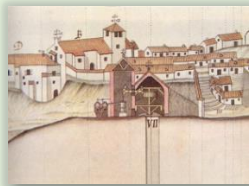
Detalle plano D. Larrañaga 1792