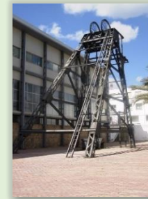
Castillete de la Mina Diógenes