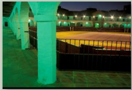
Plaza de Toros de Almadén (S.XVIII)

Siempre que hablemos de Patrimonio, nos remontamos al pasado, a la historia... Esta herencia se compone de una gran variedad de cosas: inmateriales (formas de trabajar, nuestra lengua, recuerdos, fiestas, canciones, etc.) o materiales (edificios, libros, planos, objetos arqueológicos, etc.).