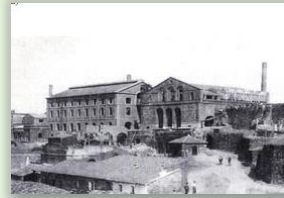
Batería de Hornos Cermak-Spirek

El patrimonio geológico está unido al patrimonio minero, ya que las explotaciones mineras se llevan a cabo sobre los yacimientos minerales y las rocas, y éstos a su vez con el patrimonio histórico, arqueológico e industrial.