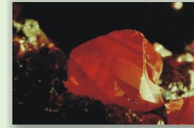
Cristal de cinabrio