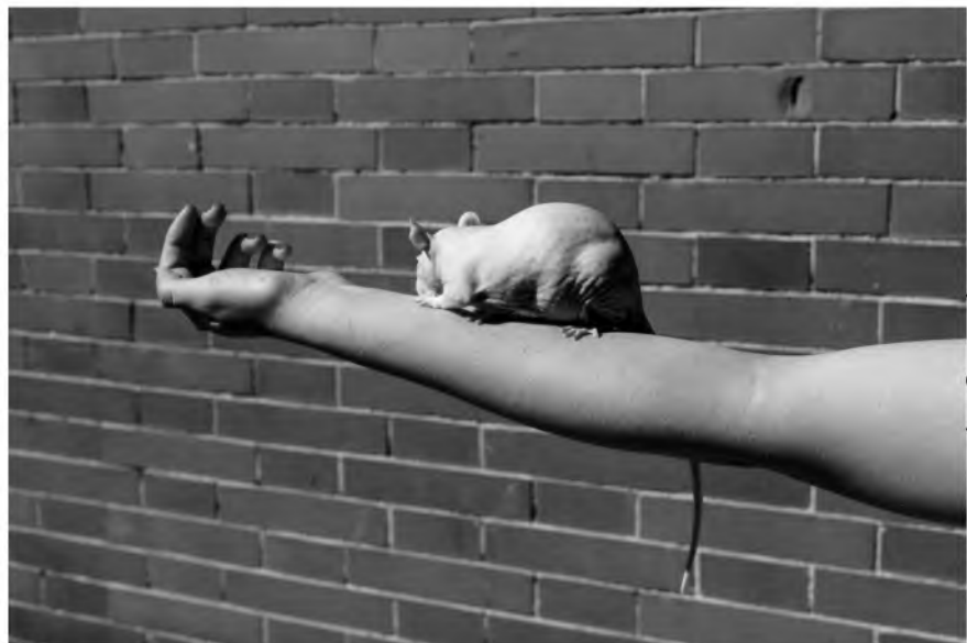
Amigos que colaboran con nosotros:

Con el color naranja como gran protagonista, el trabajo sitúa al espectador frente a esa pared y le introduce en una asfixiante atmósfera, en un hipnótico estado mental.