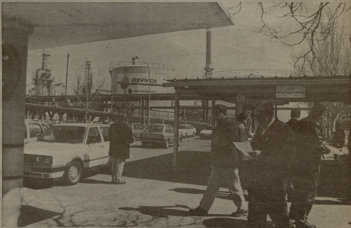
Cerca de 1.200 personas trabajan en el complejo industrial de Repsol.

dar tratamiento a todos los residuos para no desaprovecharlos, así se obtienen los siguientes productos: fuel gas, isobutano, propano, butano, gasolina, gasolina sin plomo, nafta, disolventes, keroseno para la aviación, gas-oil para automóviles, gas-oil para calefacción, azufre, fueloil y coque.