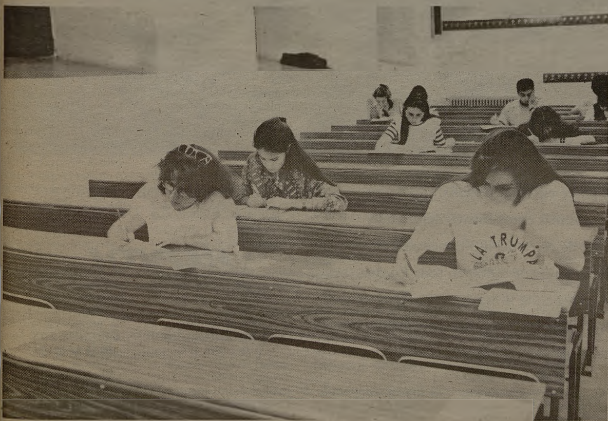
La implantación de nuevos estudios de postgrado en Puertollano facilitará una mayor especialización para los jóvenes.

Por su parte, los máximos responsables sindicales de esta comarca, consideran que la Universidad regional es muy joven y con pocos medios para diversificarse aún más. Desde los sindicatos, más que carreras universitarias, se reclaman estudios de postgrado, mediante convenios con al Universidad. Se trata de ofrecer la posibilidad de especializarse a los más jóvenes.