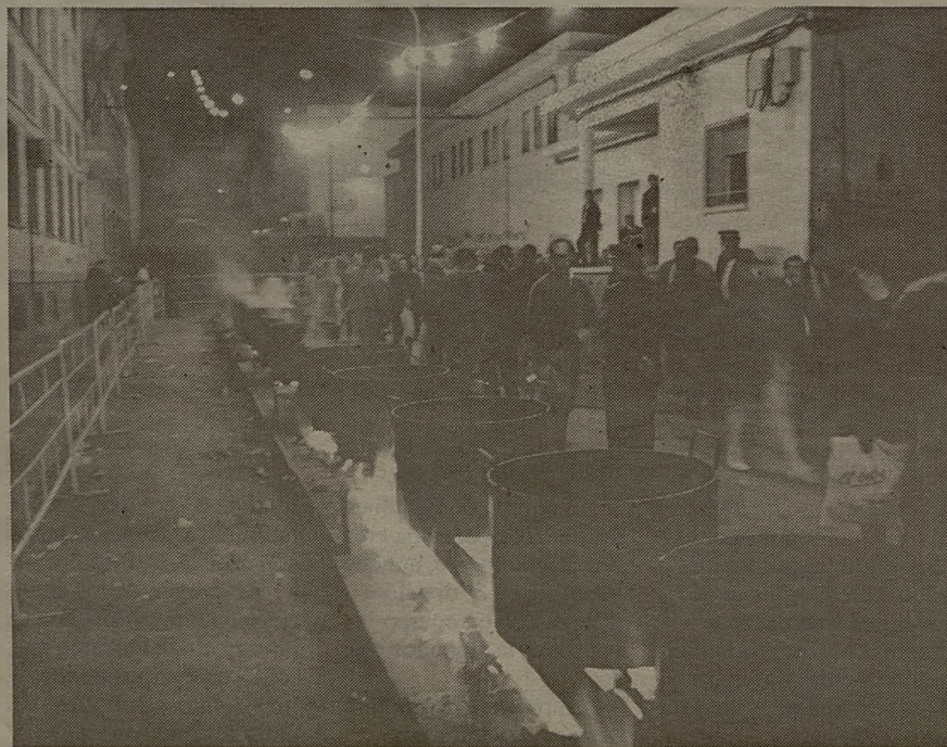
La fiesta del Voto es de las más tradicionales de Castilla-La Mancha.

También destacan la llamada Chimenea Cuadrá, un castillete en el promontorio más elevado del cerro de Santa Ana, desde el que se domina la ciudad; el Parque de la Rincona y la Dehesa Boyal, una vasta extensión de pinares con ermita y merendero que es el principal pulmón de la ciudad.