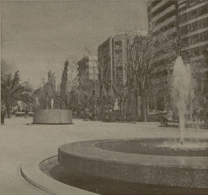
Espacios amplios y ajardinados para facilitar la vida en la ciudad.

Se han superado los 60 millones de pesetas para la remodelación de insta-