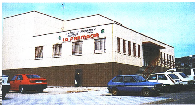
El centro social de Villa Román lleva ya dos años reivindicando una farmacia.