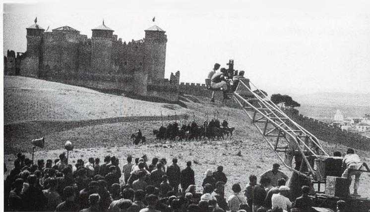
'El Cid'. Imponente el Castillo de Belmonte al fondo. Dirigida por Anthony Mann en 1961.

La película, rodada íntegramente en Cuenca, permite que nos hagamos una idea de cómo era la vida en esa época. En las calles no hay automóviles, aunque sí carruajes. El libro de José Alfaro está lleno de detalles y explica con detenimiento, junto algunos de los fotogramas, los aspectos más destacados de la época: un autobús que en 1953 realizaba la línea Cuenca-Cañizares-Solán de Cabras, y la Catedral, cubierta «por un maderamen con andamios». Además el Grupo de Danzas de la sección femenina de Cuenca aparece bailando una escena de paloteo en la placeta junto a la ermita de las Angustias.