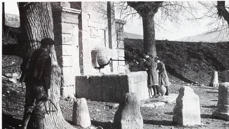
'La sobrina del cura' rodada en 1925. La desaparecida fuente de San Fernando.