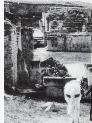
'Mar de luna' de Manolo Matji, 1994.

fleja el aburrimiento de los hombres y mujeres de la época en las capitales de provincia, y cómo logran superar esos estados constantes de aburrimiento. Es en 'Calle Mayor' donde la crudeza de una 'inocente' broma causa un fuerte dolor, haciendo que el espectador no sonría cuando los hombres, reunidos en el casino, deciden gastar una broma pesada a una solterona ilusionándola con una petición de noviazgo. Betsy Blair es la actriz británica que encarna el papel de esta solterona y que interpreta su papel con gran limpieza y serenidad. En enero de 1987, Betsy Blair volvió a España para rendir homenaje a esta obra. Blair declaró lo siguiente a los medios de comunicación: «Conocí a Bardem en el Festi-