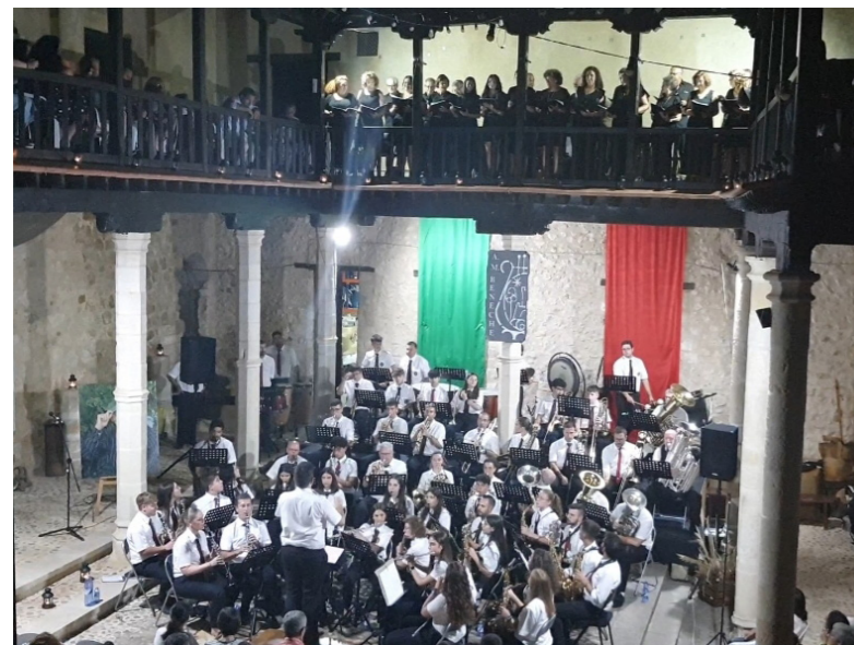
Gran concierto el de este verano

3ª Estrofa. Las viejas piedras del Castillo, Vicaría y signos señoriales, están posados en el recuerdo de días grandes. Este recuerdo redime y alienta las horas dolorosas de nuestro pueblo. Cruceros, Capas, Símbolos de la Orden militar de Santiago, Monjes y soldados. Estampa esplendorosa de un ayer relativamente reciente.